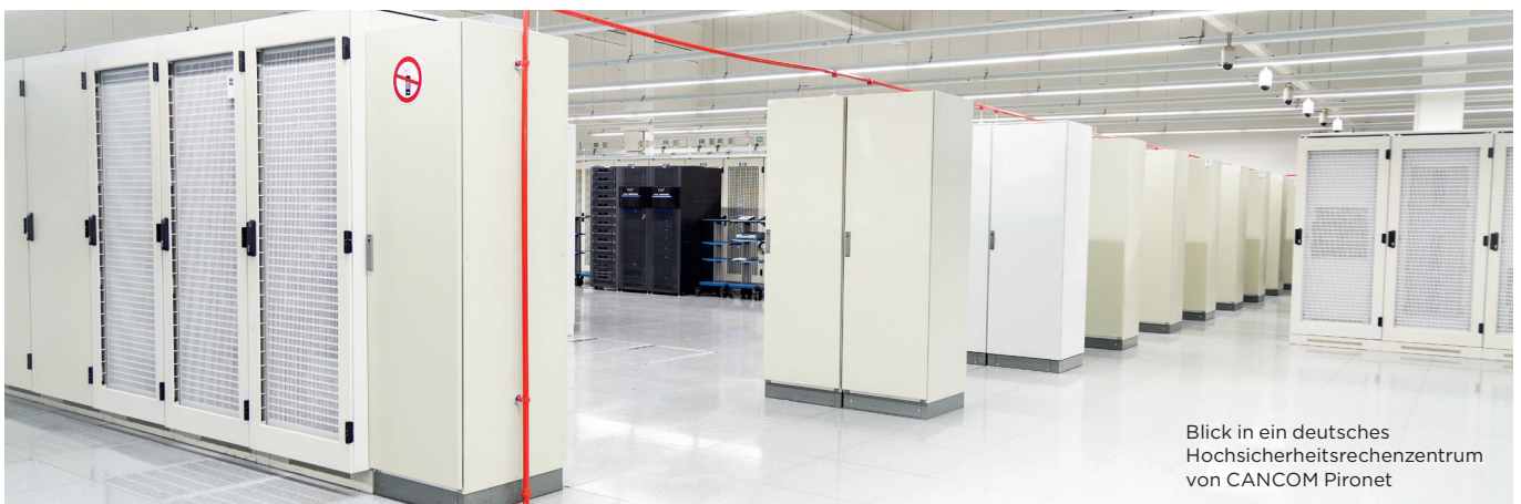
Blick in ein deutsches Hochsicherheitsrechenzentrum von CANCOM Pironet

Sparen Sie sich unnötige Investitionen in die IT-Infrastruktur, nutzen Sie Ihre unternehmensweite E-Mail-Archivierung stattdessen als Cloud-Lösung aus einem deutschen Hochsicherheitsrechenzentrum von CANCOM Pironet. Dank der Zertifizierung nach ISO 27001 profitieren Sie dabei von maximaler Informationssicherheit. Die Cloud-Technologie bietet Ihnen außerdem größtmögliche Flexibilität und Skalierbarkeit, so dass sich veränderte Anforderungen sehr rasch umsetzen lassen. Weiterer Vorteil sind Service und Support aus Deutschland. Gehen Sie auf Nummer sicher!